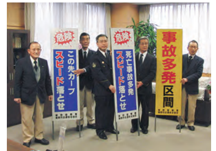
反射式立看板の贈呈