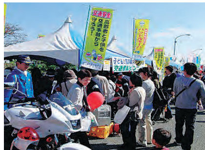
市民の日・子どもと高齢者交通安全教室