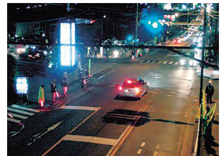
年末の交通街頭監視活動