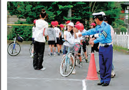
交通指導員の自転車教室