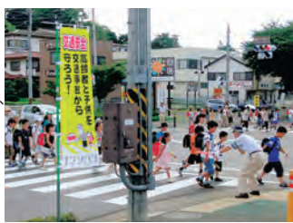
南支部役員による日赤病院入口交差点での誘導活動

南支部は、支部役員・支部母の会 28 名により、毎月 1 日・15 日の交通安全日と、各季の交通安全運動期間中に、西大竹・堀川線の 4 交差点において、集団登校の子供たちに「おはよう、行ってらっしゃい」の一声をかけて交通安全指導に努めております。私たちの目の前を通学する子供たちから「おはようございます」の元気な挨拶と無事故の登下校を何よりの励みとして活動を行っています。また、地域行事の交通整理や見えにくい市道交差点に設置されているカーブミラーの清掃と小枝切りなどを行っています。地域の交通事故防止活動を実施しています。南支部では、地域の皆様が安全で安心して暮らせる「交通事故ゼロ」の街づくりを目指し、秦野警察署等関係機関と手を携えて交通安全活動を推進していききたいと思います。これからも皆様のご理解ご協力をお願いします。