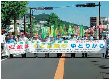
たばこ祭り・交通防犯パレード