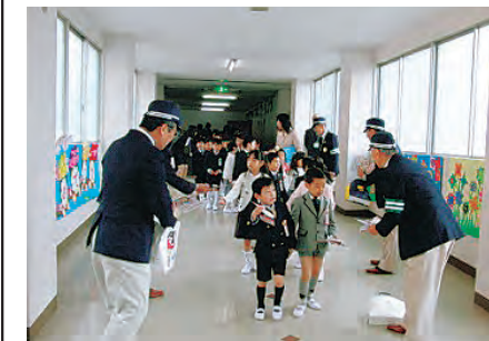
新入学児童の啓発活動