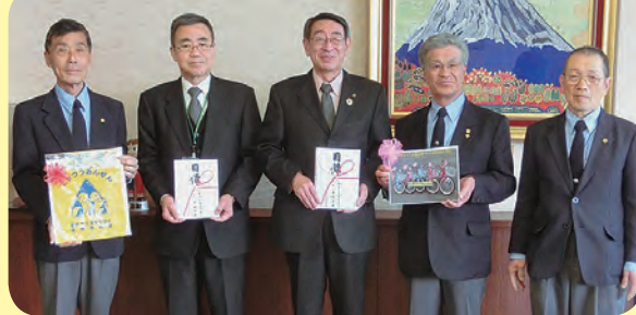
秦野市交通安全協会から、交通公園で使用する「子ども用自転車5台」と新入学一年生に「黄色のランドセルカバー」「交通安全教育冊子」県交通安全協会からの「ABCクリアファイル」を贈呈