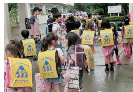
新入学児童にランドセルカバー贈呈