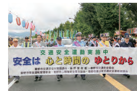
秦野たばこ祭り・交通防犯パレード