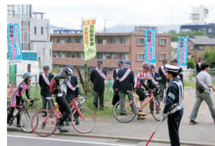
自転車マナーアップキャンペーン