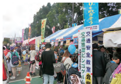
市民の日・子どもと高齢者交通安全教室