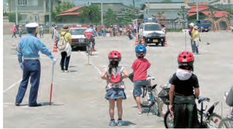
交通指導員による自転車安全教室指導

交通安全協会では、地域の交通死亡事故ゼロを目指し、子供さん・高齢者等を交通事故から守るために各種交通安全活動を推進しています。あなたも参加して活動してみませんか!