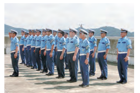
交通指導員による点検実施