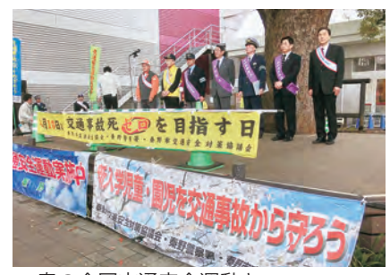
春の全国交通安全運動キャンペーン