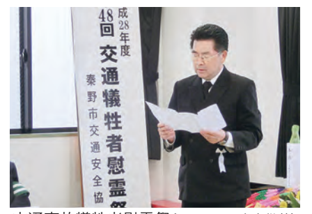
交通事故犠牲者慰霊祭(雨天のため室内供養)