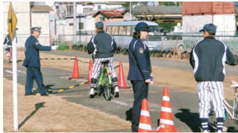
交通指導員による自転車安全教室指導

交通安全協会では、地域の交通死亡事故ゼロを目指し、子どもと高齢者等を交通事故から守るために各種交通安全活動を推進しています。あなたも地域の交通安全啓発活動に参加してみませんか!