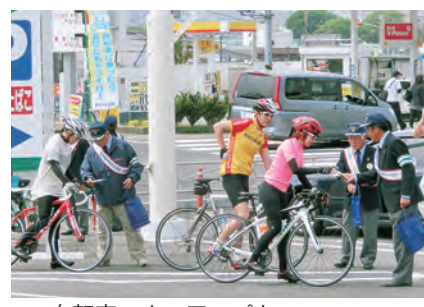
自転車マナーアップキャンペーン