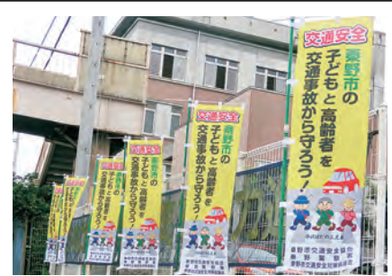
丹沢はだの三兄弟が参加、のぼり旗

平成29年1月20日文京シビックホールで開催された第57回交通安全国民運動中央大会において秦野市交通安全協会が、地域に密着した交通安全啓発活動の功績が認められ平成2年以來二度目の交通優良団体として表彰されました。