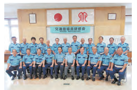
交通指導員に対する夏期研修