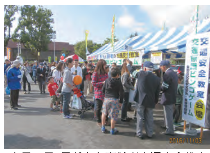
市民の日・子どもと高齢者交通安全教室