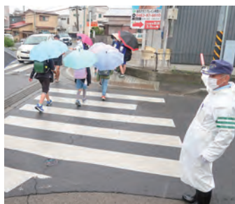
学童の見守り活動