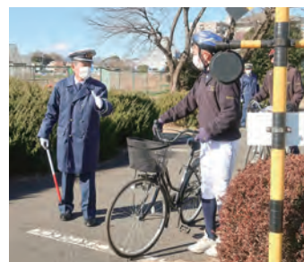
自転車交通安全教室