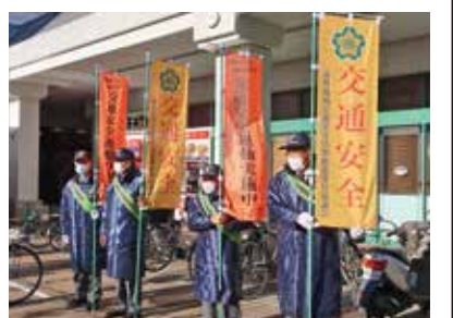
年末の交通事故防止運動